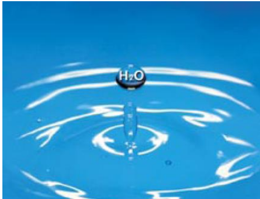
緣起法是法則，猶如“ H_2O ”；緣生法是現象，例如水、冰、蒸氣等。